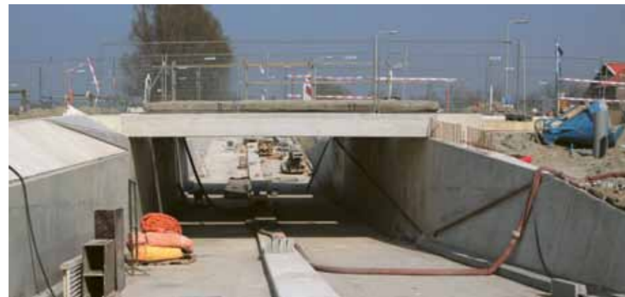
Kunstwerk 8 Vrouwenpolderseweg Serooskerke

Een weg die hoger ligt, is zichtbaarder in het open Zeeuwse landschap. Daarom wil Rijkswaterstaat bomen en struiken aanplanten en de bermen inzaaien om de weg in het landschap op te laten gaan. Zo hoopt Rijkswaterstaat zowel de weggebruikers als de omwonenden van dienst te zijn.