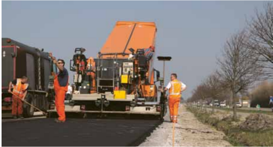
Asfaltploeg Rasenberg ter hoogte van de Kleine Putweg