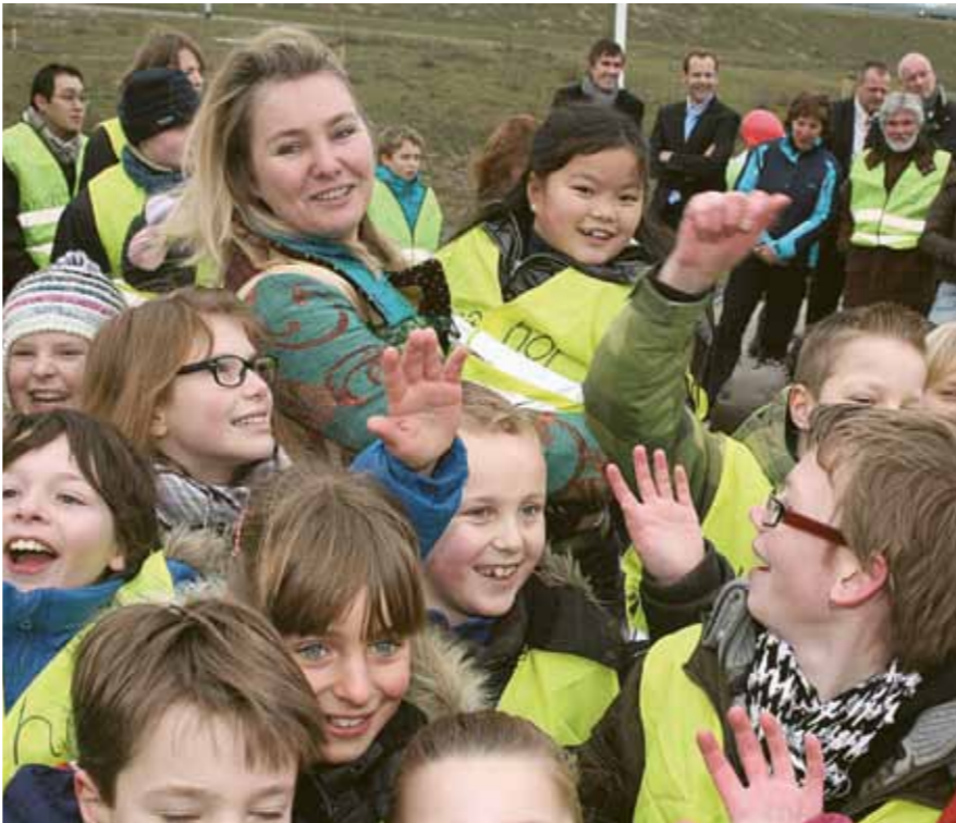
Minister Melanie Schultz van Haegen met de kinderen van basisschool Palmenhof uit Sint Laurens

Het eerste deel van de nieuwe weg loopt van de A58 tot Serooskerke. Dankzij de nieuwe weg is de grote verkeersdrukte in en om Middelburg al flink afgenomen. “De nieuwe N57 brengt veel goeds voor de regio”, vertelde minister Melanie Schultz van Haegen van Infrastructuur en Milieu tijdens de opening. “De weg zorgt voor een