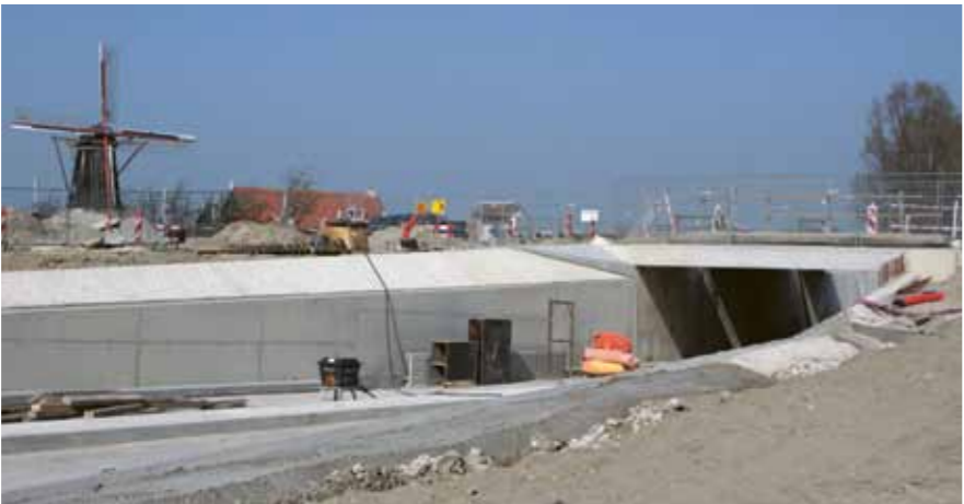
Kunstwerk 8 auto-/fietstunnel Vrouwenpolderseweg Serooskerke

Welke werkzaamheden staan er op de planning?